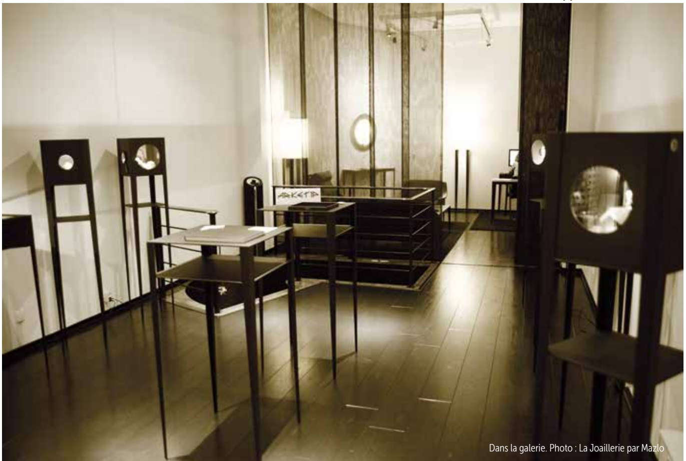
Dans la galerie.